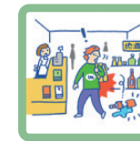
買い物中に誤って商品を壊してしまった