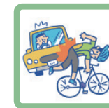
走行中に自動車と接触してケガをした