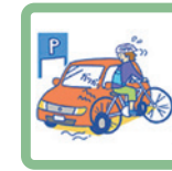
止まっている自動車に接触して傷をつけた