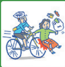
個人賠償責任補償