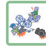
自転車でぶつかり、相手の持ち物を壊してしまった