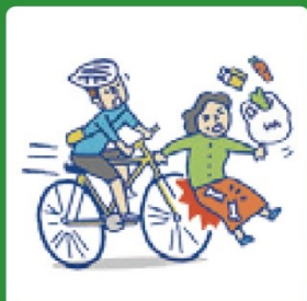
個人賠償責任補償