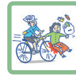
自転車走行中に相手にケガをさせた