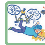
走行中に転倒してケガをした