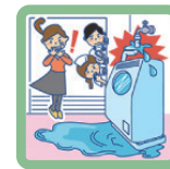
洗濯機の水漏れで階下が水浸しになった