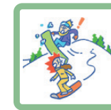
スノーボード中にケガをさせた