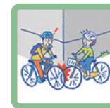
走行中に自転車と接触してケガをした