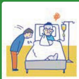
示談代行サービス