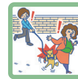
飼い犬が人をかんでケガをさせた