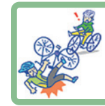
自転車同士でぶつかって相手にケガをさせた