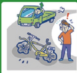
自転車ロードサービス