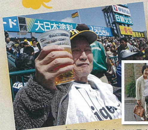
阪神タイガース 観戦 (甲子園球場)