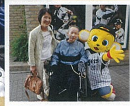
甲子園で飲むビールは最高!