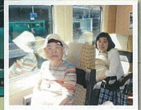
2泊3日の温泉旅行。ゆったりお湯に入って極楽気分!