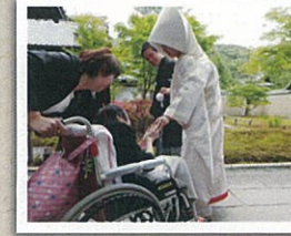
大切な記念の日。ご家族と感動の一日を!