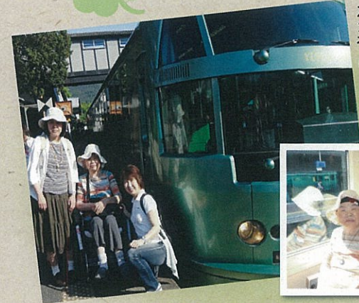
列車で行く 春の由布岳! (湯布院)