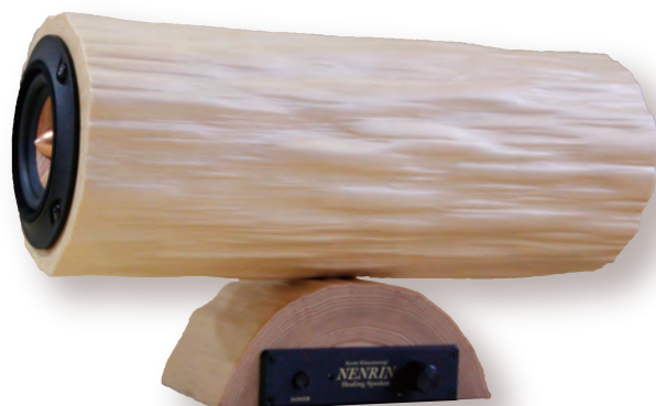
2. 天然木肌の美しさ

「NENRIN mini JINSHIBO」北山人造絞丸太 (ナチュラルカラー／ダークカラー)