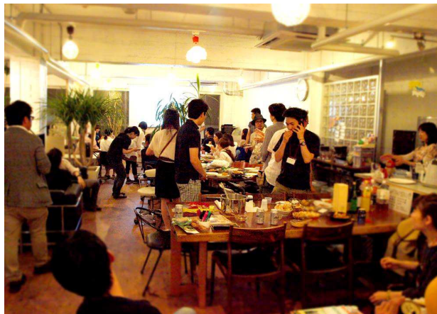
《 イベントの様子 》