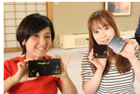
先行体験のお客様