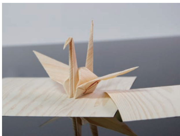
←薄さ 0.1mm 京乃木肌で作った折り紙です。