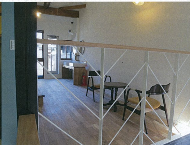
表棟と裏棟の間に位置するルーフバルコニ。(写真左) 町家の代名詞。通り庭の吹き抜け。(写真下)