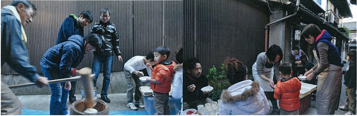
京だんらん東福寺で近所の方々をお誘いした餅つきも地域交流イベントの1つ。(写真上)