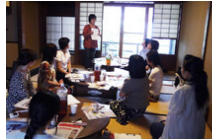
前向きな人たちの出会いがある、ランチ会です

そんな思いを持つ働く女性の方たちで集まり、交流会では仕事や経験、思いや知恵を語り合います。