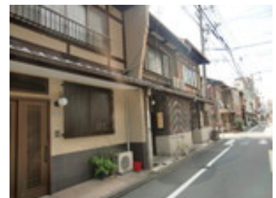
下町情緒あふれる、築80年の京町家で