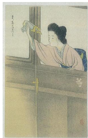
「浪さん」上村松園画