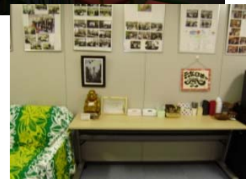
大阪の中心部、梅田のセミナー ルーム。ベンチャー企業が集まる 最先端のしゃれたオフィスの空間で。