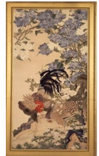
綴織額「紫陽花双鶏図」 株式会社川島織物セルコン織物文化館蔵