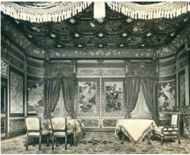
室内装飾「若冲の間」完成写真