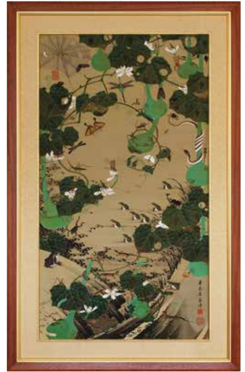
綴織額「池辺群虫図」 日本伝承染織振興会蔵