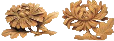
木彫「菊花折枝」 (株)川島織物セルコン 織物文化館蔵