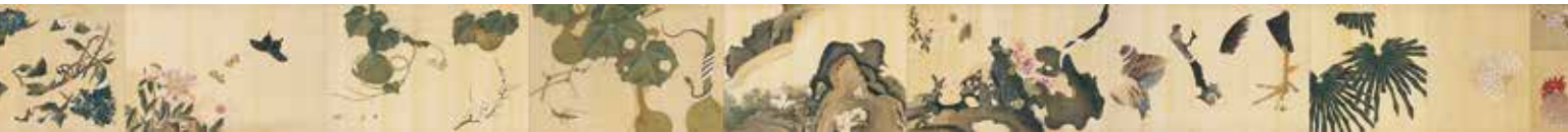
綴織壁飾用部分模写画「動植綵絵」(部分) (株)川島織物セルコン織物文化館蔵

1904年、アメリカがフランスからルイジアナ州一帯を購入してから100年を記念して開催され、日本は日露戦争の渦中にもかかわらず、この万博に国家の威信をかけて大規模な日本村を建設しました。また併せてセントルイスオリンピックも開催され、世界中の注目を集めました。川島織物も今回展示中の「若冲の間」をはじめ、「網代の間」、綴織壁掛「蒙古襲来」を出展し、名誉大賞などを受賞しました。