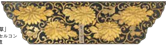
蒔絵「菊唐草」 (株)川島織物セルコン 織物文化館蔵