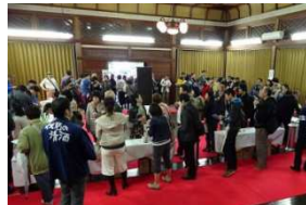
日本酒まつりの様子