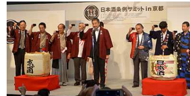
日本酒条例サミット in 京都