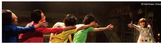
言葉を全く使わず五感を刺激することで表現