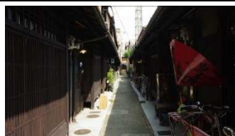
あじき路地の風景