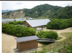
「和久傳の森」づくり