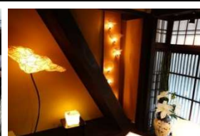
若手クリエイターたちの住居兼工房が並ぶ