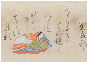
女歌仙小型絵巻 居初つな画 江戸時代 個人蔵