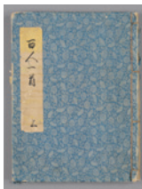
奈良絵本百人一首 江戸時代 個人蔵