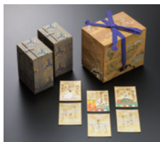
百人一首かるた 居初つな画 江戸時代 個人蔵