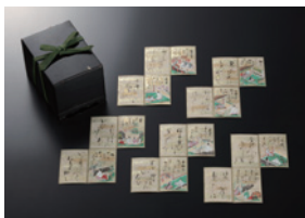
源氏物語かるた 江戸時代 小倉百人一首文化財団蔵