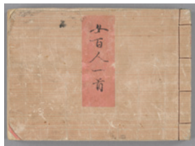
女百人一首 嘉永4年(1851) 個人蔵