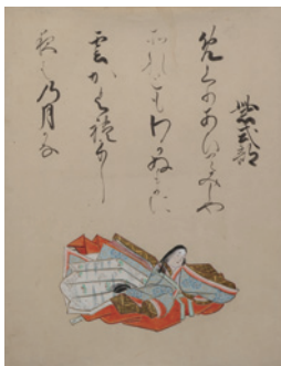
百人一首画帖 清原雪信画 江戸時代 小倉百人一首文化財団蔵