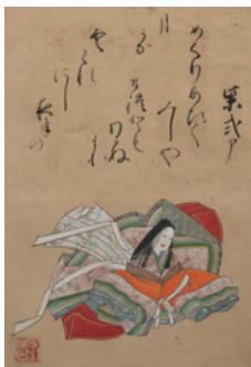
百人一首手鑑 長谷川宗園画 江戸時代 小倉百人一首文化財団蔵