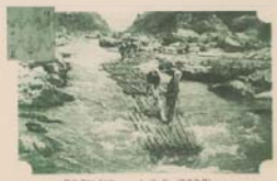
保津川下り絵はがき(昭和初期)