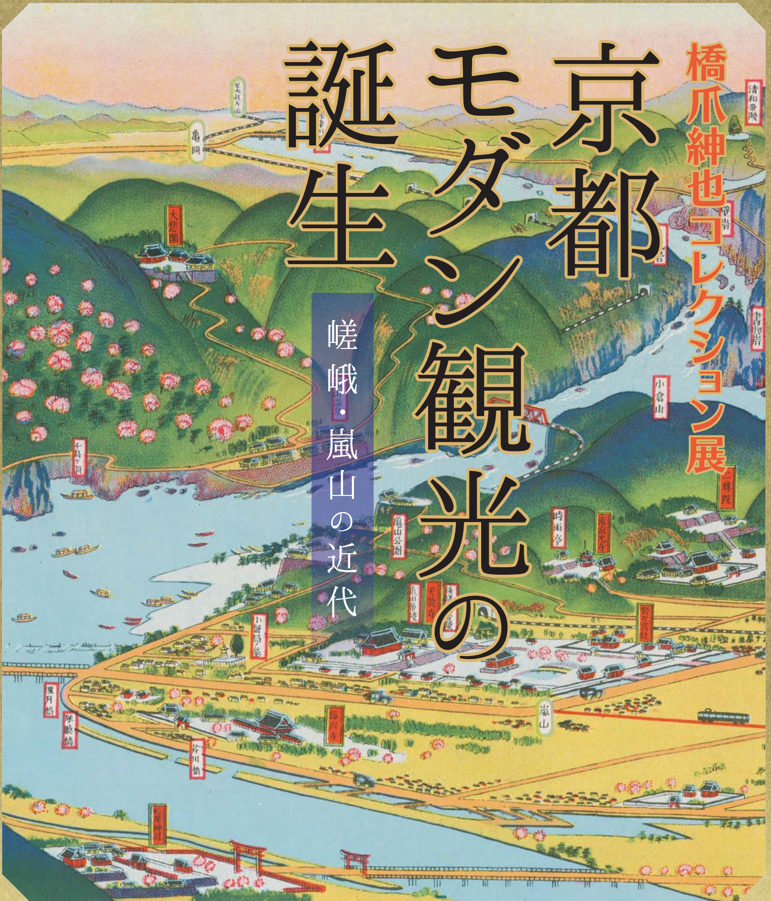
洛西交通名所図絵(部分) 吉田初三郎画 京都市教育会発行(1928)