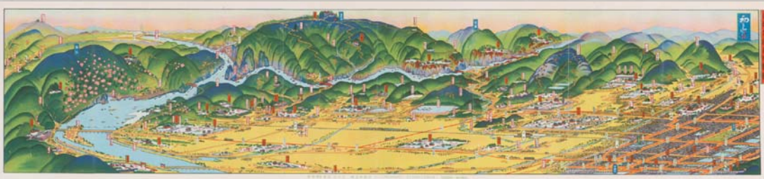
洛西交通名所図絵 吉田初三郎画 京都市教育会発行(1928)

1960年大阪市生まれ。京都大学工学部建築学科卒業、大阪大学大学院工学研究科博士課程修了。建築史・都市文化論専攻。工学博士。現在、大阪府立大学21世紀科学研究機構教授、大阪府立大学観光産業戦略研究所長、大阪市立大学都市研究プラザ特任教授、国際日本文化研究センター客員教授。著書に『明治の迷宮都市』(平凡社・筑摩書房)、『モダニズムのニッポン』(角川学芸出版)、『瀬戸内海モダニズム周遊』、『大京都モダニズム観光』(ともに芸術新聞社)など多数。