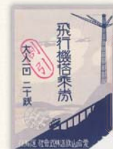
飛行機搭乗券(昭和初期)