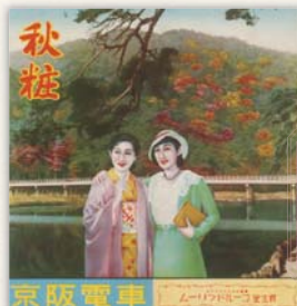
秋粧 京阪電車発行(昭和初期)