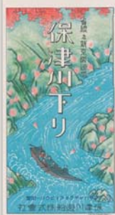
保津川下りパンフレット (昭和初期)