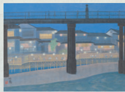
鴨川夜景 小野竹喬