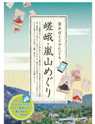
音声ガイドマップ