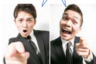
MC/Wマコト(中山真/中原誠)

【集合場所】嵐電四条大宮駅改札内 男性9:40集合 女性9:50集合 【参加料】男性6,000円 女性4,000円 おいしいバイキングランチ付 【参加資格】京都・嵐山を愛する独身 ※35歳まで 【募集人員】男性30名 女性30名