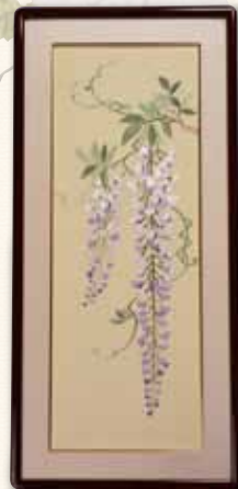
藤裏葉(ふじのうらば)