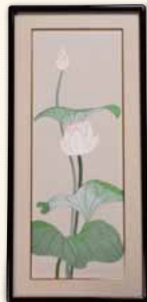
夢浮橋(ゆめのうきはし)