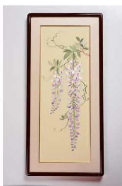
藤裏葉(ふじのうらば)