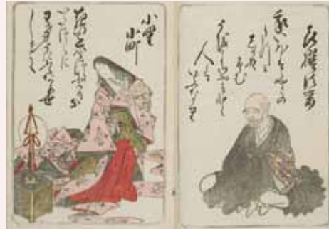
錦百人一首あづま織 勝川春章画 安永4年（1775）個人蔵