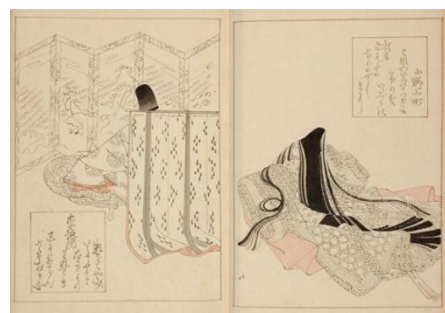
聯珠百人一首 岡田為恭画 明治28年 個人蔵