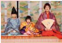
■平安装束の着装体験 (男性：狩衣、女性：袿)