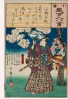
小倉百人一首 歌川広重画 弘化3年頃（1846）個人蔵