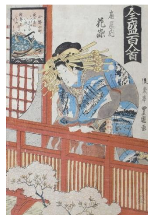
全盛百人一首 歌川豊国(二代)画 江戸時代 個人蔵