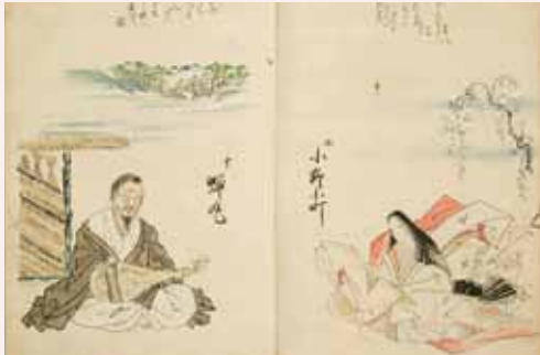
百人一首画帖 狩野探幽模写画 江戸時代 跡見学園女子大学蔵 ※展示期間 3/4 ~ 3/30