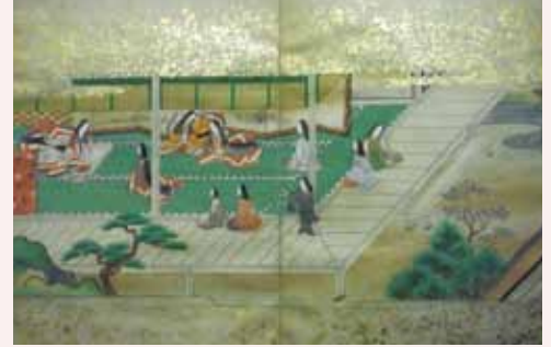
小町草紙 江戸時代 個人蔵 ※展示期間 1/5 ~ 2/16