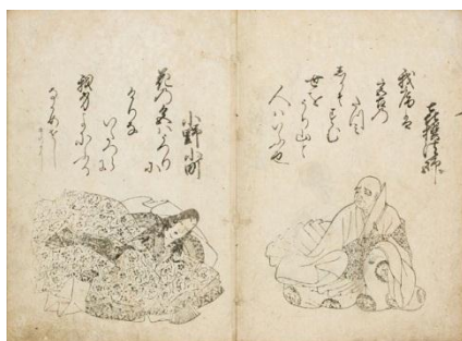
百人一首 素庵本模刻画 江戸時代 跡見学園女子大学蔵 ※展示期間 1/5～2/16