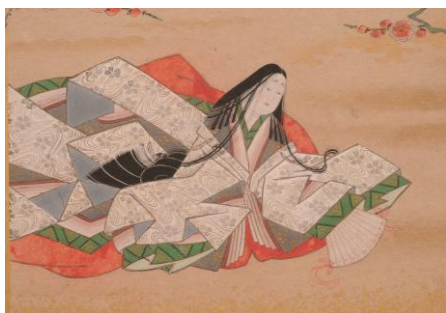
三十六歌仙画切絵色紙手鑑 江戸時代 個人蔵 ※展示期間 1/5～2/16

今回の企画展では、百人一首を代表する女流歌人・小野小町を取り上げ、近世に描かれた華麗な歌仙絵や小町伝説をもとにしたユーモラスな絵画、小町を主人公にした謡曲に関する作品などを展示し、その多様な魅力の一端をご紹介します。