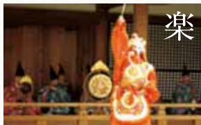
舞楽公演 王朝びとを魅了した音と舞を楽しむ