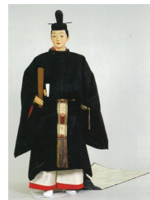
公家女房 裙帯比礼の物具姿(左) 公家東帯(右) ※いずれも復元