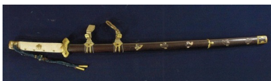
細太刀(三条家伝来) 江戸時代