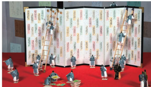
藤原定家と小倉山荘 平成23年(2011)