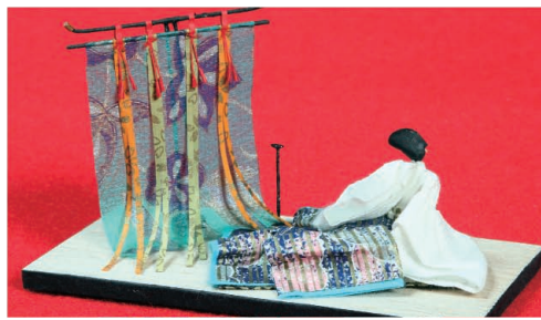
第九十一番 後京極摂政前太政大臣 「きりぎりす 鳴くや霜夜の さむしるに 衣かたしき ひとりかも寝む」