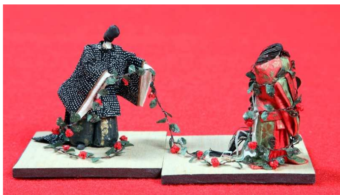
第25番 三条右大臣 「名にしおはば 逢坂山の さねかづら 人に知られで くるよしもがな」