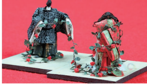
第二十五番 三条右大臣 「名にしおほまほ 逢坂山の さねかつら 人に知られで くるよしもがな」