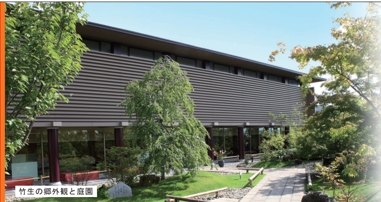
竹生の郷外観と庭園