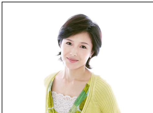
水野 真紀【特別ゲスト】

15歳でモデルデビューし、'05年から海外のファッションショーで活躍。'07年から女優活動をスタートし、話題作に多数出演。9月30日からNHK連続テレビ小説「ごちそうさん」のヒロインを務める。