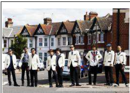
東京スカパラダイスオーケストラ

1987年 第2回「東宝シンデレラ」審査員特別賞。NHK「凜凛と」でデビュー。その後、ドラマやCM、映画、バラエティなど幅広く活躍。代表作は「蝉しぐれ」(NHK)「スチュワーデス刑事」シリーズ(CX)など。