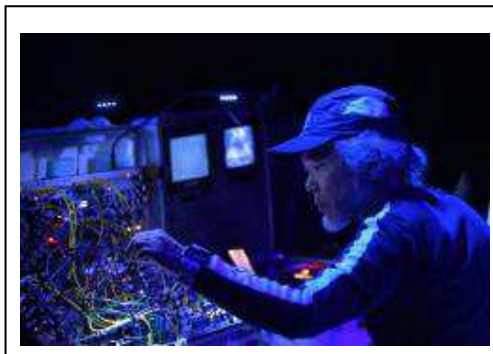
ヤン 富田【アーティスト】

ルーツのスカをベースにジャンルにとらわれない幅広い音楽性で人気を集める、世界屈指のライブバンド。多数の海外公演を含むライブパフォーマンスは2,000本を超える。