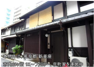
本物件は、風良都 新金座 市内88カ所 1K～ファミリー、京町家を運営中