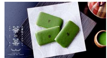
写真:参加者への手土産