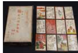
▲むべ山かるた（昭和時代）