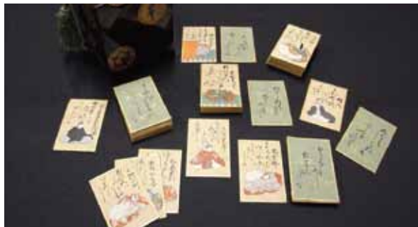
▲百人一首かるた（江戸時代）

企画展の開催に合わせて、さまざまな百人一首のかるたを展示します。江戸時代に作られた高級品の肉筆かるたや版彩色かるた、1つの札に上句と下句が書かれた明治時代のかるたや賭博用の「むべ山かるた」など、百人一首のかるたの魅力をご紹介します。また歌の場面を再現した夢舞台も冬の場面に展示替します。