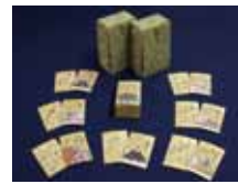
▲百人一首かるた（江戸時代）滴翠美術館蔵 ※後期展示（2/13～3/3）