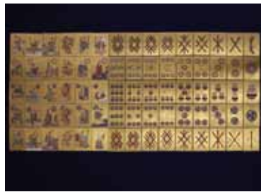
▲うんすんかるた（江戸時代） 滴翠美術館蔵

今回の企画展では、かるたのコレクションで有名な滴翠美術館（兵庫県芦屋市）のご協力のもと、さまざまなかるたを展示し、その魅力をご紹介します。