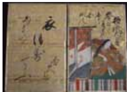
▲百人一首かるた（江戸時代）