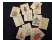
▲謡曲かるた（明治時代）個人蔵