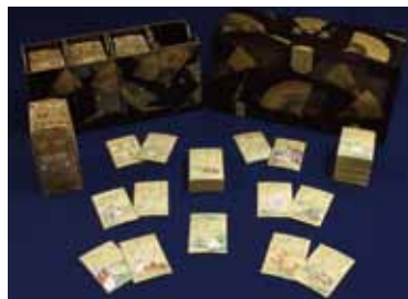
▲伊勢物語絵入歌かるた（江戸時代） 滴翠美術館蔵 ※前期展示（1/5～2/11）