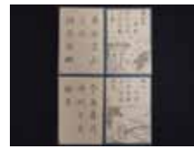
▲詩かるた（江戸時代）個人蔵