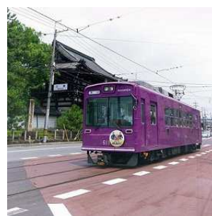
嵐電 (京福電気鉄道株式会社)