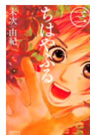
コミック「ちはやふる」 第3巻