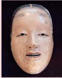
深井 喜兵衛作(桃山時代) 田中氏奉納装束 文化14年(1817)