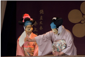
娘(お多福 向かって左)と母(美人)

嵯峨大念仏狂言独自の演目で、コミカルな要素をもった「ヤワラカモン」に分類される。登場人物は釈迦、寺侍、坊主、母親(美人)、娘(お多福)の5人。坊主と寺侍が釈迦を本堂に据え拝んでいるところに母親と娘がやって来て物語が展開する。無言劇特有の大きな身振りやユーモラスな動きが特徴。