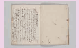
百人一首宗紙抄 寛永元年(1624)写