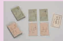
百人一首かるた 壺鑑寺宮宗栄筆(江戸時代)