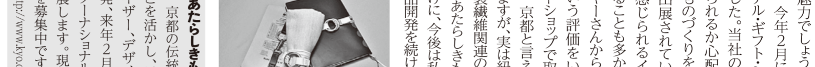
様々な用途に使用可能

「あたらしきもの京都」とは、京都の伝統的な技術や素材、知恵などを活かして、デザイナーやアパレルメーカー、デザイナーと共に新商品を開発し、来年2月に開催される「東京インターナショナルギフトショー」へ共同出展します。現在、今年度の企画事業者を募集中です。(6月7日締切)