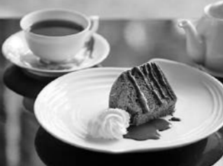
代表お手製のシフォンケーキ