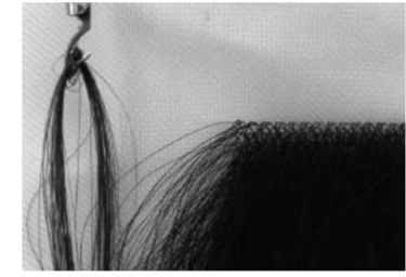
かぎ針と育毛イメージ

— 技術開発の糸口は? — これまで培ってきた技術を、かつらの植毛や靴下のつま先を閉じる製造工程に活用します。例えば、和布団の生地を糸を結ぶために独自設計した特殊なかぎ針の改良や「編み」の動きを自動機に置き換えることで、「ヘアネット」をくくりつける作業や靴下の細かな網目に針を通す作業を機械化します。熟練者は、他の高度な作業に専念できるなど、メーカの生産現場における効率