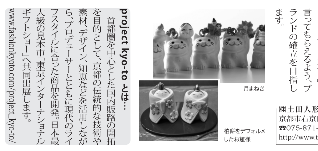
柏餅をデフォルメしたお雛様 (株)土田人形 京都市右京区梅津南町1-10 ☎075-871-6834 http://www.tutida-ningyo.com

アロマ根付は、1月は鏡餅、2月はおたふく面というように季節に応じて様々な小物を持たせており、思わずコレクションしたくなる愛らしさが魅力です。香りを持ち運ぶという視点に立てば、様々な市場開拓の可能性が広がると思えます。京都の社寺オリジナルの「お守り」根付けや、企業のノベルティ商品の開発にも挑戦していきたく、現代のニーズに合った独自のブランド商品を開発し、これまでは違う市場を開拓できなかったと考えたのがきっかけでした。