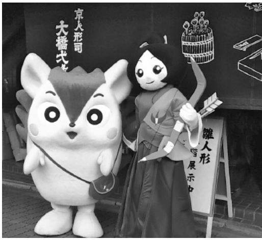
ポんきち(左)とおせんちゃん

より多くの皆さんにキャラクターの存在を知ってもらおう! そんな思いで、着ぐるみやシル、ストラップを制作し、商店街を少し身近に感じてもらえるよう工夫しています。昨年11月には、経営支援員の提案で商店街全体を100円ショップに見立て、各店舗が選