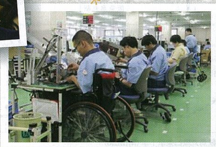
オムロン京都太陽仕事風景