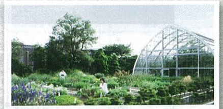
日本新菜(山科植物資料館)

そこで、「日本でいちばん大切にしたい会社」の著者で、7,000社以上の企業等を訪問し、調査・アドバイスをされている法政大学大学院教授坂本 光司氏をお招きし、先進的な取組をされている企業や、経営者を紹介いただきます。また、京都の企業で実践している事例もご紹介いたします。皆様のご参加を心よりお待ちしております。