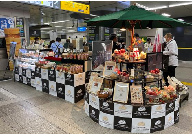
駅構内での臨時売店（食品）