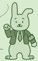
経営支援キャラクター みみよりさん