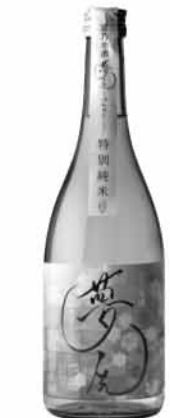
夢先 特別純米酒 1500円

源氏物語千年紀協賛事業の一環として、都鶴酒造と京都市産業技術研究所工業技術センターが共同開発した特別醸造酒が「夢先」。特別純米酒と純米吟醸、純米大吟醸の三種類が用意されている。新酒のときは端麗でキレのある味わいだが、熟成を重ねるごとにフルーティーでまろやかな口当たりになるという。白ワインのように、女