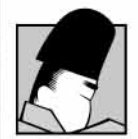
キャラクター光源氏

源氏物語千年紀事業では、京都・関西はもとより日本全国、そして世界の、多くの団体・企業・NPO・個人より幅広いご賛同・ご参画を得て、「源氏物語千年紀委員会」が核となり、多彩な取り組みを実施・展開しています。源氏物語千年紀の各種ロゴ・シンボルマークについても、同委員会が一括管理しています。事業についてご理解いただき、販促物やメディア、商品などにてご使用を希望される場合は、事務局まで申請書をご提出ください(申請書はホームページよりダウンロードできます)。