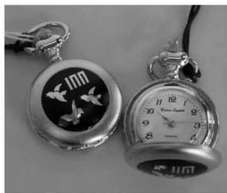
象嵌 懐中時計 若紫 11550円

繊細緻密な象嵌技巧を使って和装小物などの新商品を開発 もともと『源氏物語』にまつわる伝統や文化に関心をもち、川人さん自ら『源氏物語』に「特に源氏香で用いられる伝統紋様は、デザイン面からみても洗練されている」と話す。今回、源氏物語千年紀事業に取り組みにあたって、川人さん自ら『源氏物語』五十四帖をあらためて解釈し直し、象嵌という京都の伝統工芸の中にどのように入らせるかを考えたそう。そうして用意されたアイテムは、懐中時計や帯留、バッグハンガーなど四種類。『源氏物語』の舞台となっている平安時代の「和」のイメージから、和装小物をラインナップの中心に据えた。「象嵌ならではの緻密さ、優雅さ」という商品に具現化しようと考えた」という。