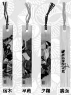
宿木 早蕨 夕霧 裏面