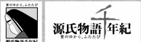
ロゴタイプ・シンボルマーク(Bタイプ) ※他にA・Cタイプがあります

源氏物語千年紀事業では、京都・関西はもとより日本全国、そして世界の、多くの団体・企業・NPO・個人より幅広いご賛同・ご参画を得て、「源氏物語千年紀委員会」が核となり、多彩な取り組みを実施・展開しています。源氏物語千年紀の各種ロゴ・シンボルマークについても、同委員会が一括管理しています。事業についてご理解いただき、販促物やメディア、商品などにてご使用を希望される場合は、事務局まで申請書をご提出ください(申請書はホームページよりダウンロードできます)。