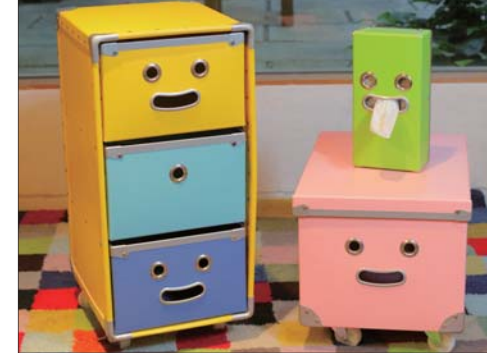
ファイバー製のオリジナル収納ボックスは軽くて丈夫

The Creative Cultural Industry Model Enterprise Selection