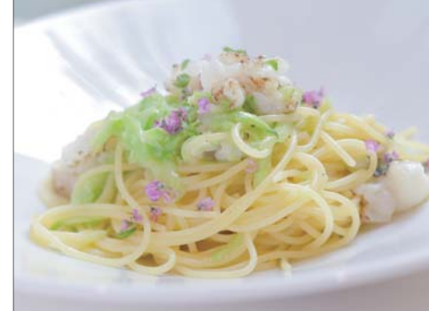
京の味覚を閉じ込めた「穴子と京きゅうりのバヴェッティエーネ 花穂じそ風味」

The Creative Cultural Industry Model Enterprise Selection