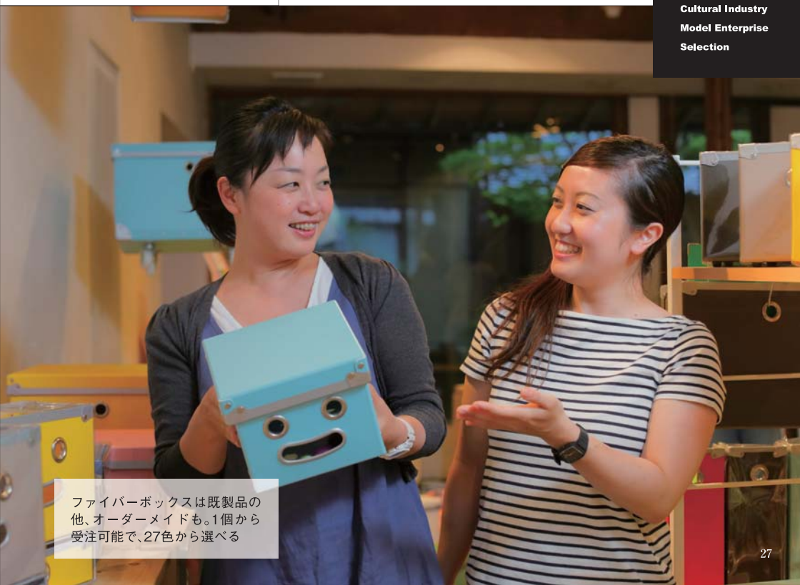
ファイバーボックスは既製品の他、オーダーメイドも。1個から受注可能で、27色から選べる