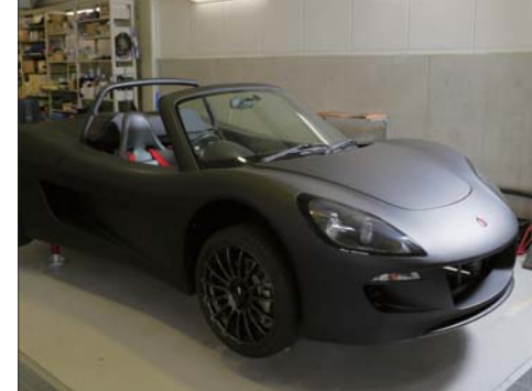
EVスポーツカーならではの加速とクイックハンドリングを実現した「Tommykaira ZZ」

The Creative Cultural Industry Model Enterprise Selection