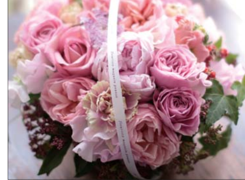
色彩のグラデーションが美しいプーゼスタイルのアレンジメント