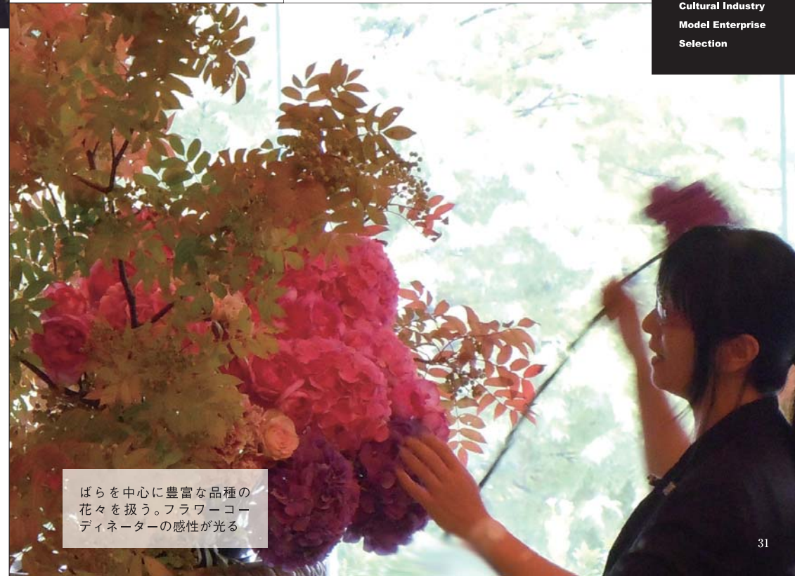
ばらを中心に豊富な品種の花々を扱う。フラワーコーディネーターの感性が光る