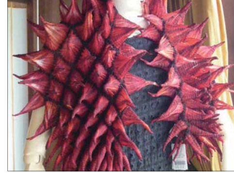
ツンツンとした立体感が持ち味の 唄絞りスカーフ