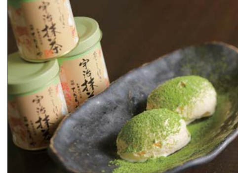
手軽に料理や菓子にかけられる「茶こし付宇治抹茶」

The Creative Cultural Industry Model Enterprise Selection