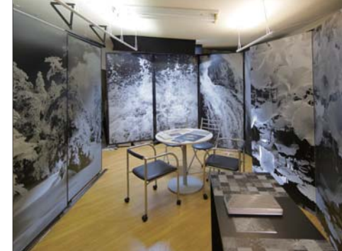
「刻鋳®」とは、立体的に画像を浮かび上がら せるメタルアートレリーフである