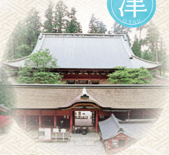
比叡山延暦寺 根本中堂(全景)