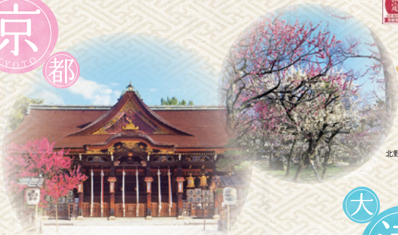
北野天満宮 御本殿