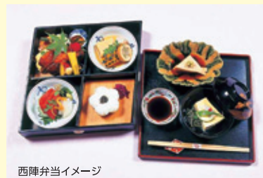
西陣魚新イメージ

安政2年から続く西陣の老舗。有職(ゆうそく)式包丁の流れを汲み、大正・昭和天皇の大礼(即位大饗の宴)にお祝い料理を御用達した由緒ある料亭。お昼の有職西陣弁当をお楽しみください。