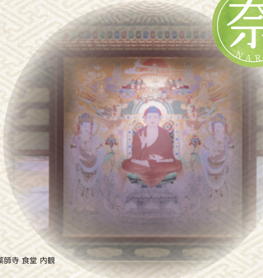
薬師寺 食堂 内観