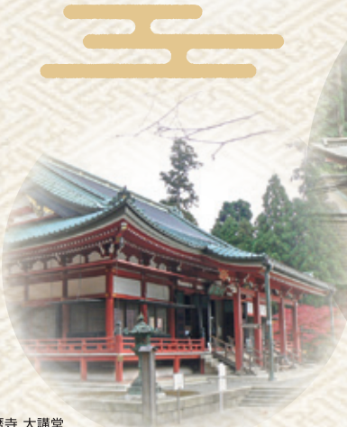
比叡山延暦寺 大講堂