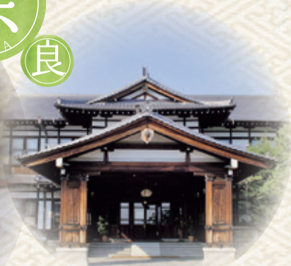
奈良ホテル・玄関

文化遺産を学ぶ旅、その保存と活用を目指して 古より継承される三都(京都、大津、奈良)文化財の魅力に迫る