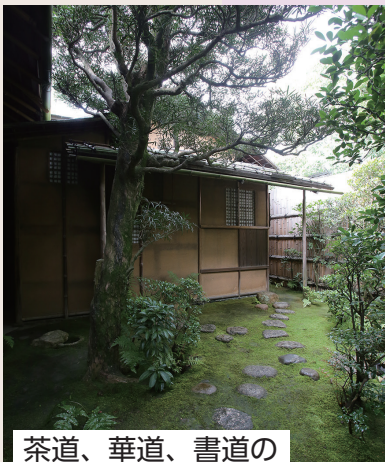
茶道、華道、書道の 実演、体験、展示