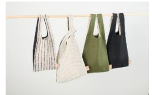
(株)ルシエール・ジャパン