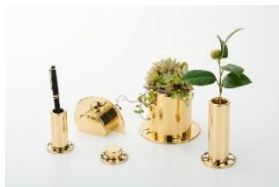
アマタ エムシーエフ(株)