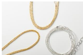
(株)寺島保太良商店