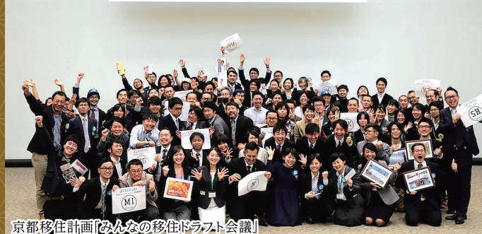
京都移住計画「みんなの移住ドラフト会議」