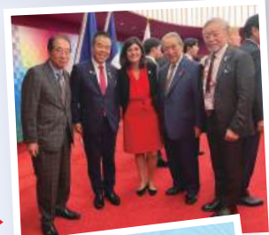
フランス ナショナルデー ▶