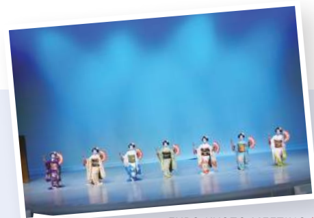
EXPO KYOTO MEETING ▲