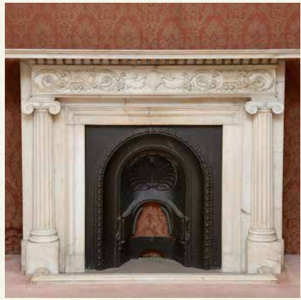
二代目ビルの遺構②「暖炉」

1階の北側玄関ロビーに鎮座するのは、二代目ビルの遺構となる大理石柱。三代目ビル設計者の富家氏が二代目ビル設計者の武田五一氏に敬意を払い残したものだと思われる。