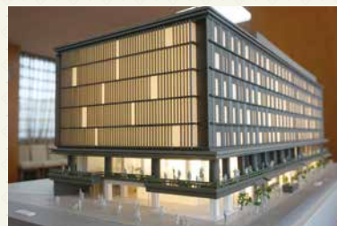
来春にオープンする京都経済センター(模型)

2019年3月5日より、京都商工会議所は京都経済センター(四条室町)にて新たな一步を踏み出します。