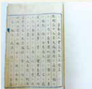
京都設立に関する資料(複製)

【日時】12月12日(水)～14日(金) 10:00～16:00 15日(土)10:00～18:00 【会場】本所 3階 役員室、会頭室