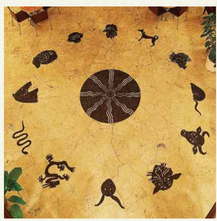
十二支のモニュメント

3階の特別応接室には、二代目ビルの暖炉が移築されている。暖炉として使用することはできないが、当時の重厚な造りが見て取れる。