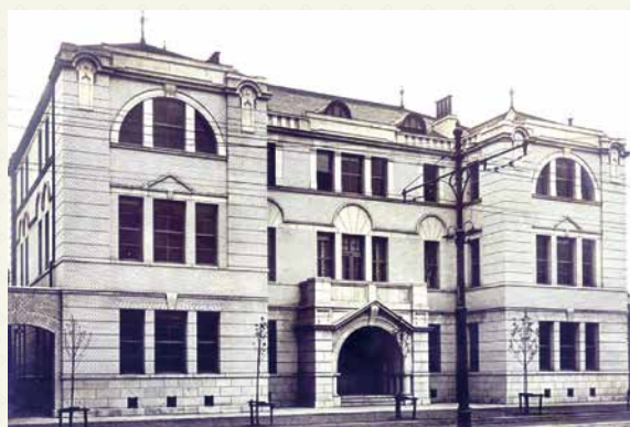
大理石を使用した近代建築の二代目ビル