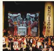
平安建都1200年記念事業 (平安建都1200年記念事業史より)