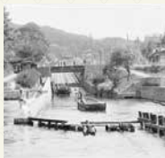
琵琶湖疏水インクライン