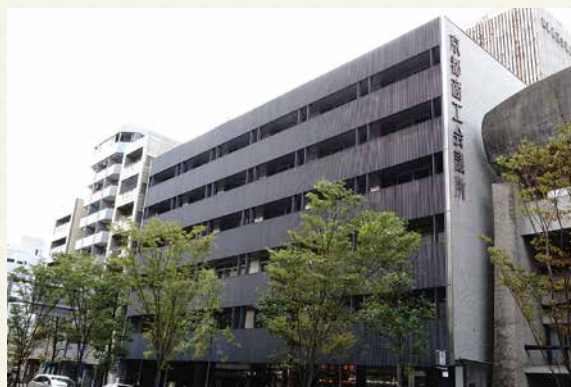
地下1階地上6階建の三代目ビル。手前に見えるのは本所創立130周年記念の植樹