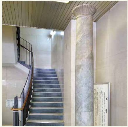
二代目ビルの遺構①「大理石柱」

閉館記念イベント「会議所ビル探訪ツアー」にご参加いただき、 ぜひとも間近でご覧ください!