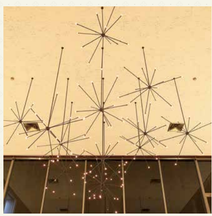
中央ロビーの照明（シャンデリア）

1階中央ロビーの床には、十二支のモニュメントが大理石のモザイクで描かれている。普段は喫茶店フロアとなっており全景を見ることができないが、閉館記念イベント中はテーブル等を撤去しご覧いただける予定。