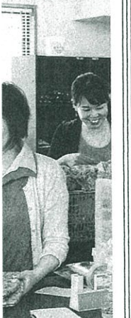
抱っこひも収納カバー

9%)、愛知県(5.7%)を中。神戸市が12月に開催する「科学技術イノベーション」をテーマにしたイベントに出場する予定だ。大学に眠る技術シーズも