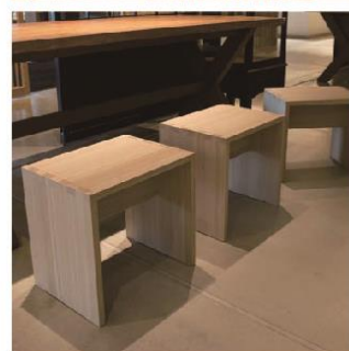
産業観光プラザ すみだ まち処