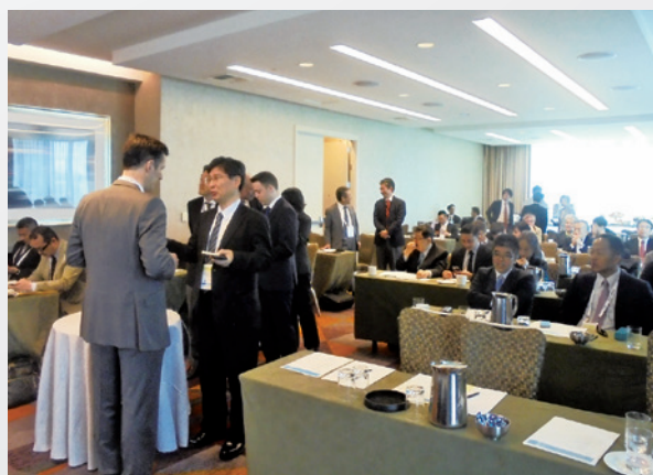
企業交流会の様子

展示会の前日である6月6日に、ジャパンパビリオン出展者向けの特典としてプリストル・マイヤーズ・スクイブ社など海外大手製薬企業4社とのクローズドな企業交流会を実施しました。海外各社のプレゼンの後、登壇者との交流を行い、参加者は自社技術をPRするなど積極的な売り込みを行いました。