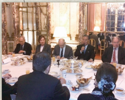
ガイ代会頭は「職人なくて伝統なし、伝統なくてパリはない」とコメント。京都にも通じるものがあると感じました。