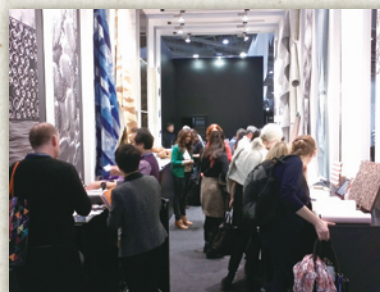
京朋(株) (京友禅の技法を生かしたクッション、ファブリック) Kyoto Contemporary Project (京焼清水焼と京漆器) 吉川染匠(株) (京友禅を生かしたポタン、ファブリック) (株)丸二 (京からかみを生かした壁紙、パネル)