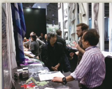
川並鉄工(株) (特殊加工を行った金属パネル) 京洛工芸(株) (象嵌の技法を生かしたパネル) (株)遊禅庵 (革友禅染を生かした小物、素材) 渡文(株) (西陣織のファブリック)