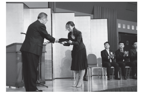
前回の認定証授与式