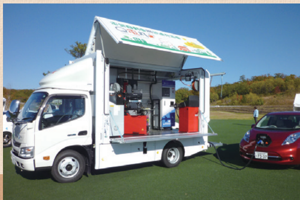
移動用急速充電車「Q電丸」