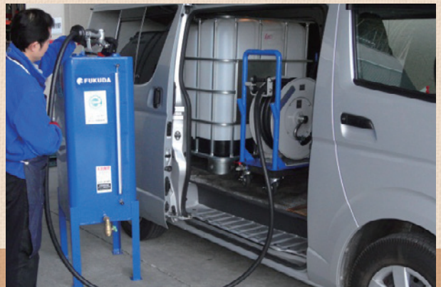
IBCコンテナによるエンジンオイルの量り売り「IBCローリーサービス」