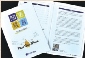
「知恵の経営」報告書