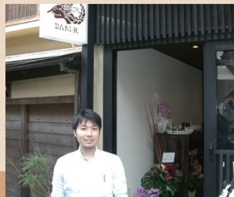
オープンした祇園の新店舗の前で。